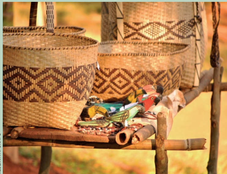
▲ En la Reserva Aponapó se trabaja con las comunidades mbyá y los colonos rurales en producción agrícola sustentable y talleres de oficios.