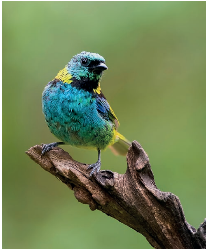
▲ San Sebastián de la Selva se dedica al turismo de naturaleza y se transformó en destino elegido por los fotógrafos de aves, que obtienen excelentes tomas de especies como el tangará alcalde y el sairá arcoiris .