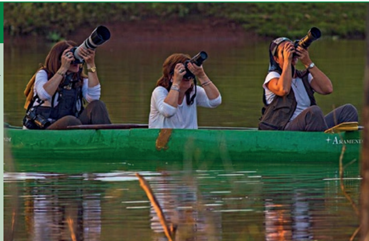
▲ En la zona de Andresito, en el noreste de Misiones, varias reservas se dedican al turismo de naturaleza como forma de financiarse.