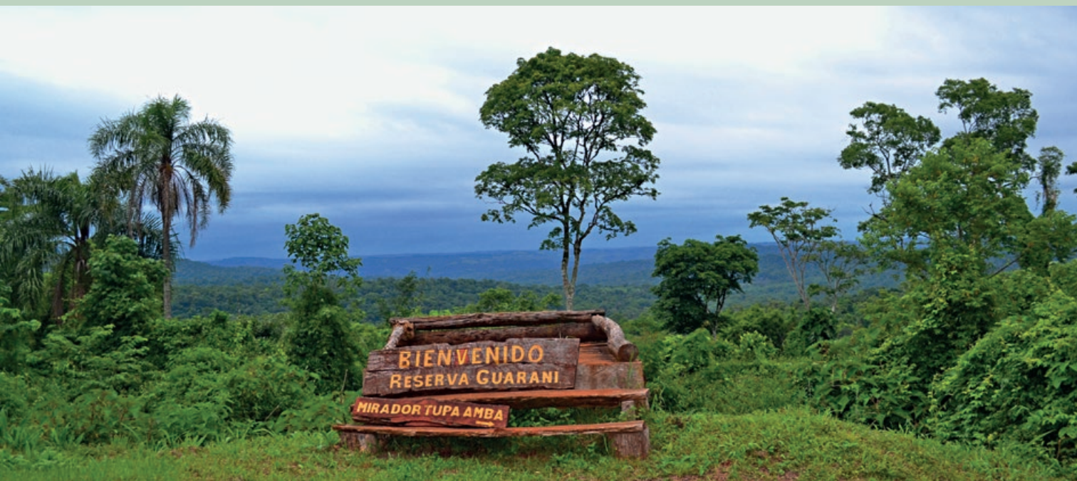
▲ En la Reserva de Usos Múltiples Guaraní, que forma parte de la Reserva de Biosfera Yabotí, se realizan estudios sobre manejo sustentable del bosque nativo.