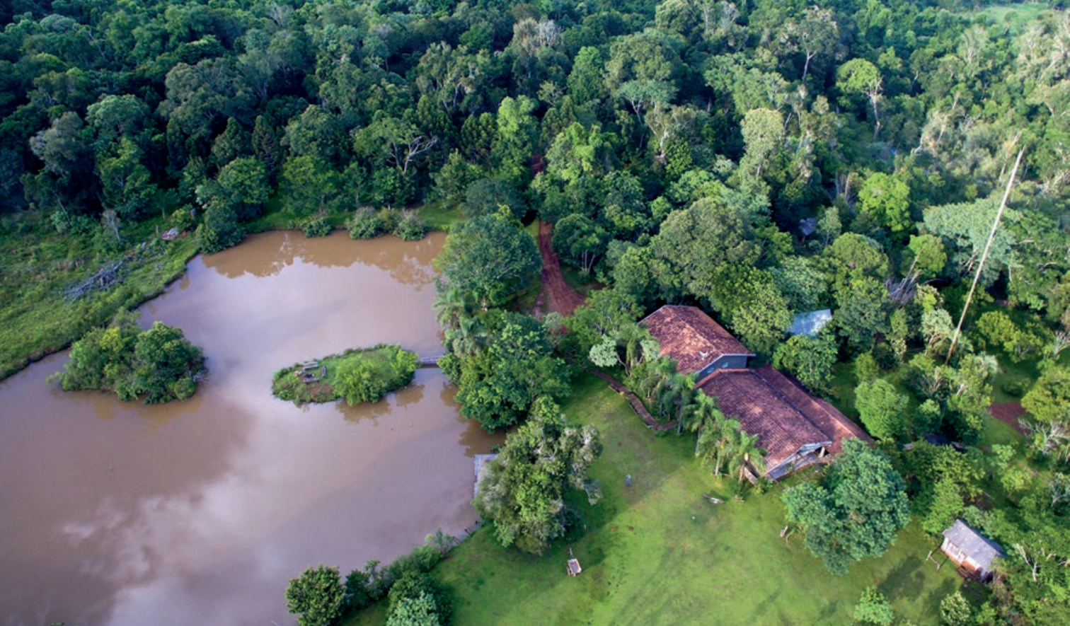
▲ Vista aérea de la Reserva Privada San Sebastián de la Selva. Una de las reservas de la zona noreste de Misiones que garantizan la conectividad entre los parques provinciales Urugua-í y Guardaparque Horacio Foerster.