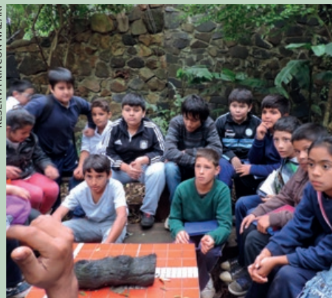
◀ Actividades educativas en la Reserva Rincón Nazarí. ▼