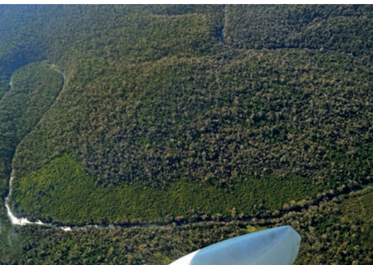
RESERVA DE USOS MÚLTIPLES GUARANÍ