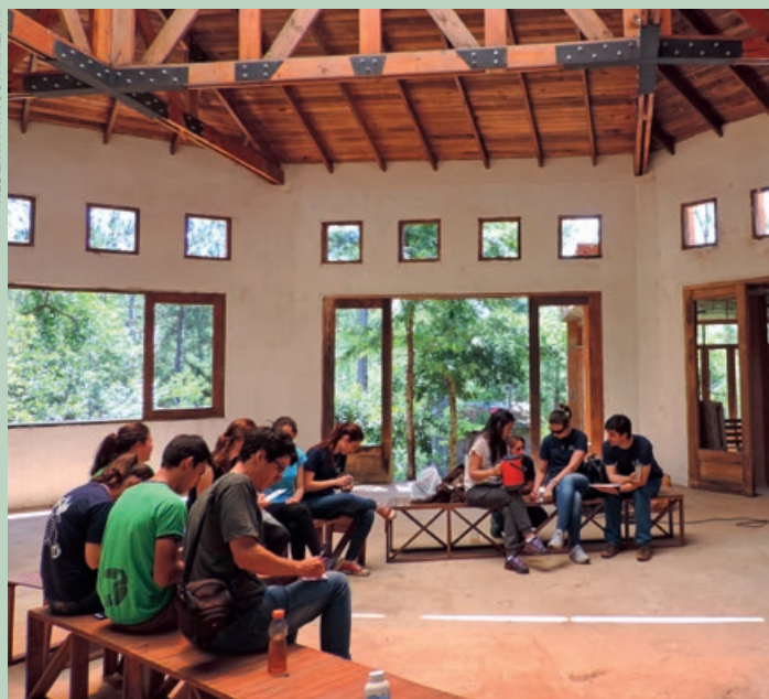
RESERVA RINCÓN NAZARÍ